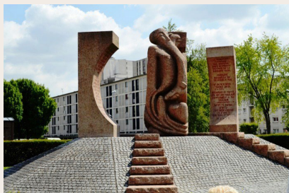
Mémorial de la Shoah