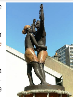
Statue en mémoire des victimes de l'esclavage